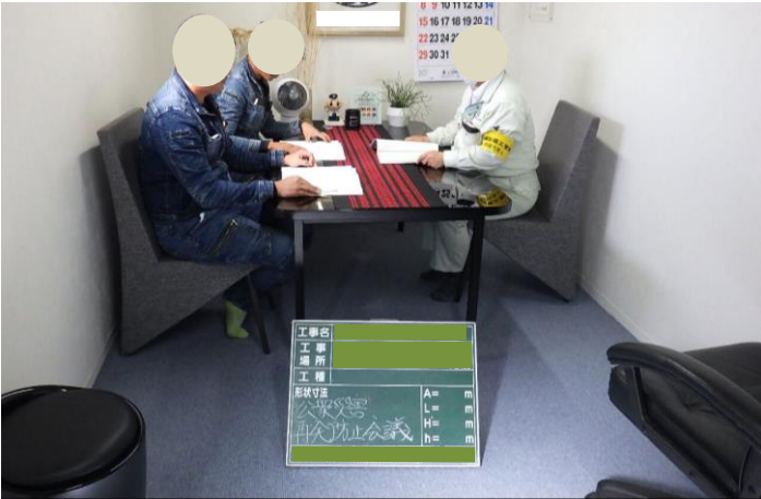
安全対策の周知状況